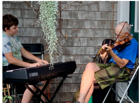
Muziki na dansi ya New England