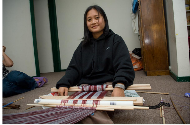
Ufumaji wa Kiburma