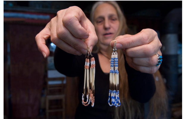
Trabajo con cuentas Abenaki