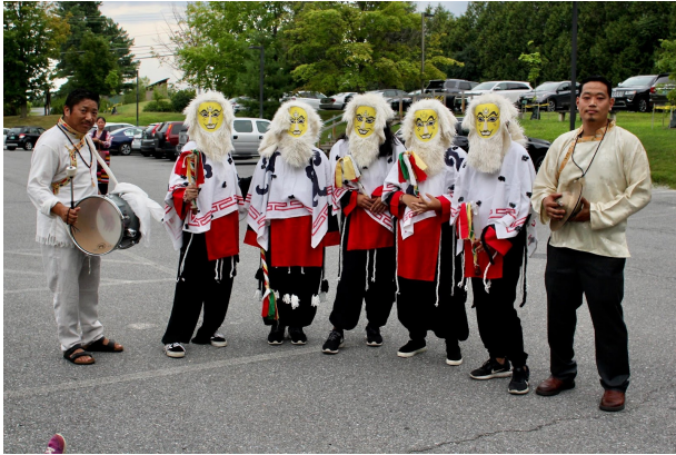
Tashi shoepa: Música y danzas tibetanas